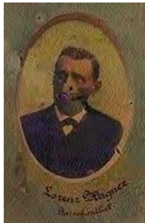
Detail aus der Zusammenstellung sämtlicher Bürgermeister in der Bezirkshauptmannschaft Mistelbach, 1902.