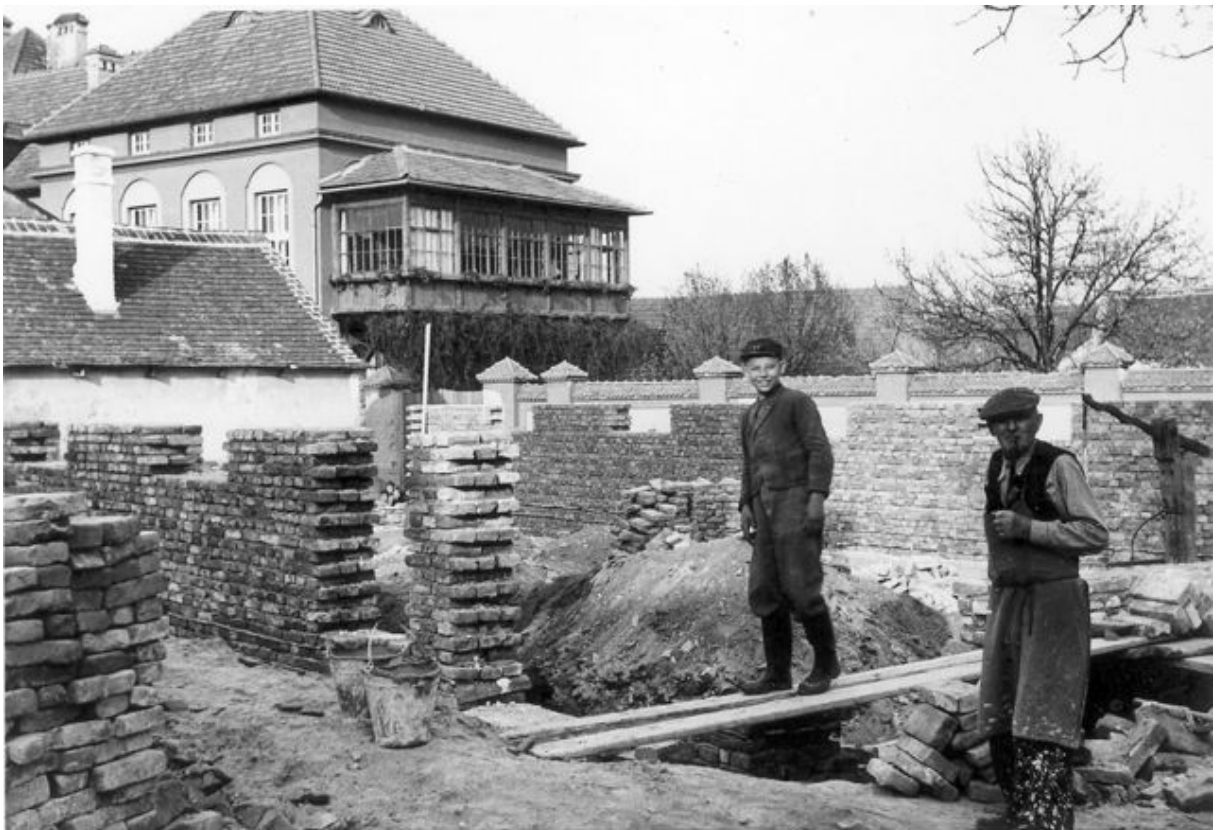
Bild 4, die Baustelle, im Hintergrund das Kloster St. Martha, 1953.