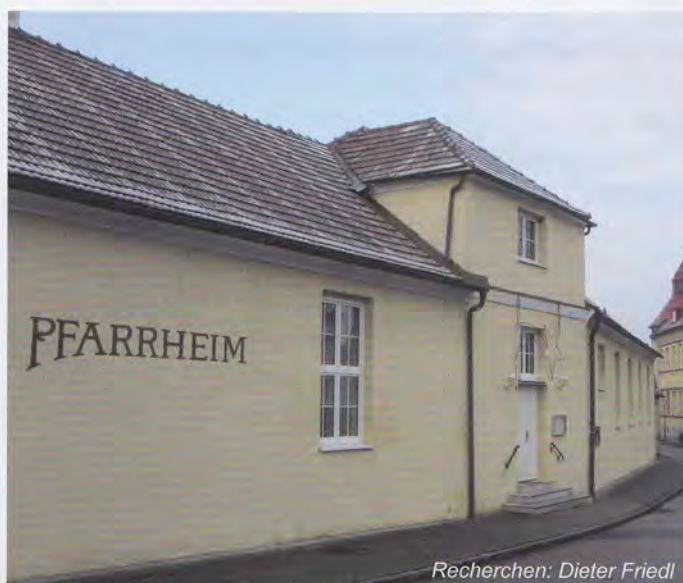
Recherchen: Dieter Friedl

Als in den Monaten Juni bis August 1971 die Kirche renoviert wurde, fanden die Gottesdienste im Pfarrheim statt. Auch bei der nächsten sehr umfassenden Innenrenovierung/Trockenlegung der Kirche von 1990 bis 1992 wurden die hl. Messen im Pfarrheim zelebriert.