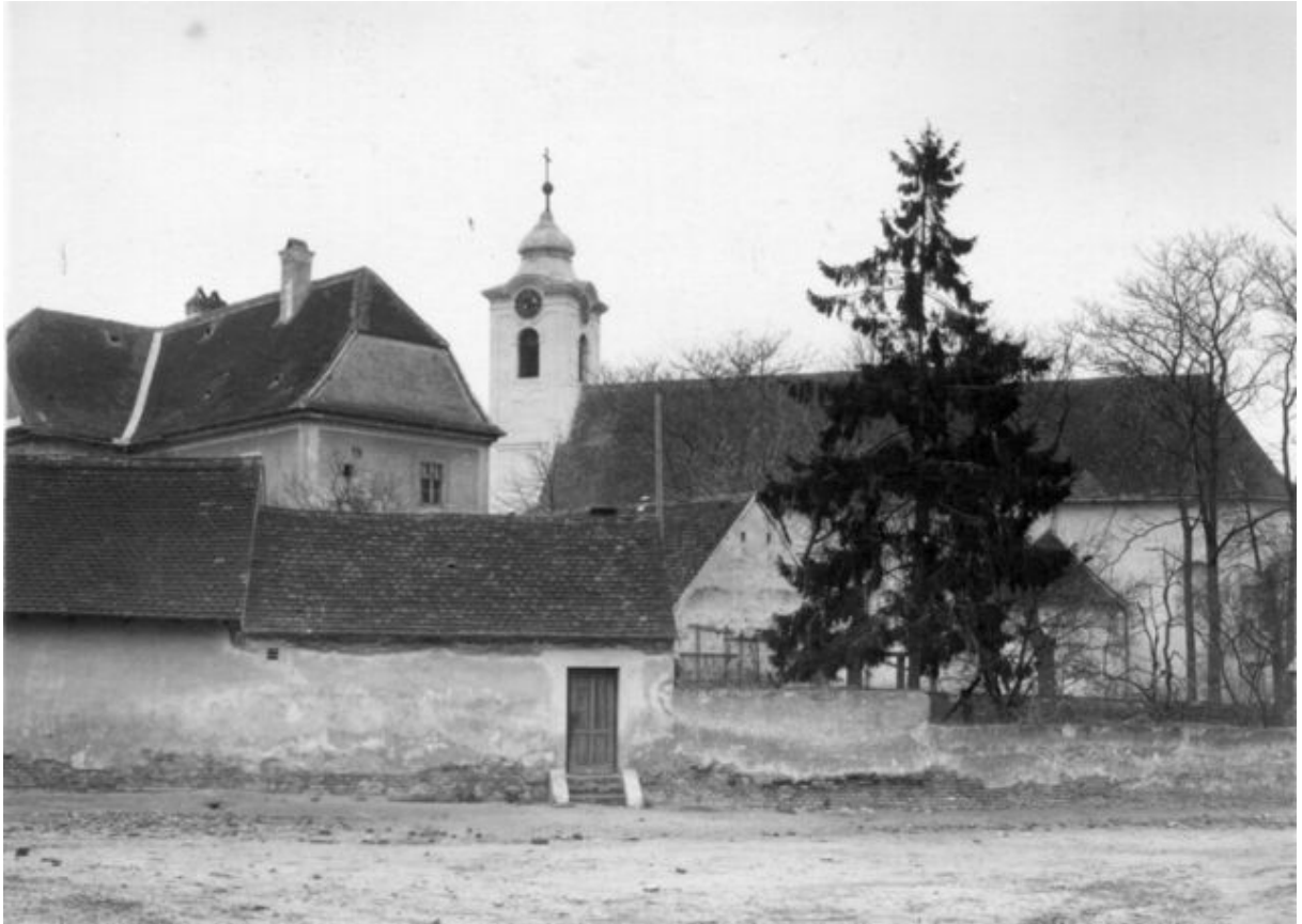
Bild 1, die Pfarrhof-Gartenmauer, Ansicht vom Museumsplatz, 1923.