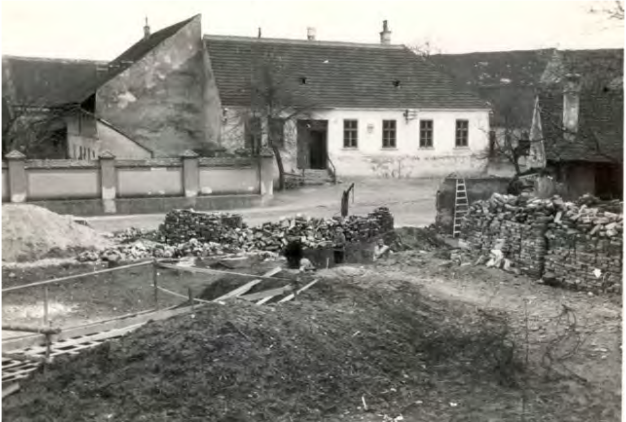
Bild 3, die Baustelle, im Hintergrund das ehem. Gemeinde-/Postamt, 1953, in welchem sich heute das „Otto Berger Heimatmuseum“ befindet.