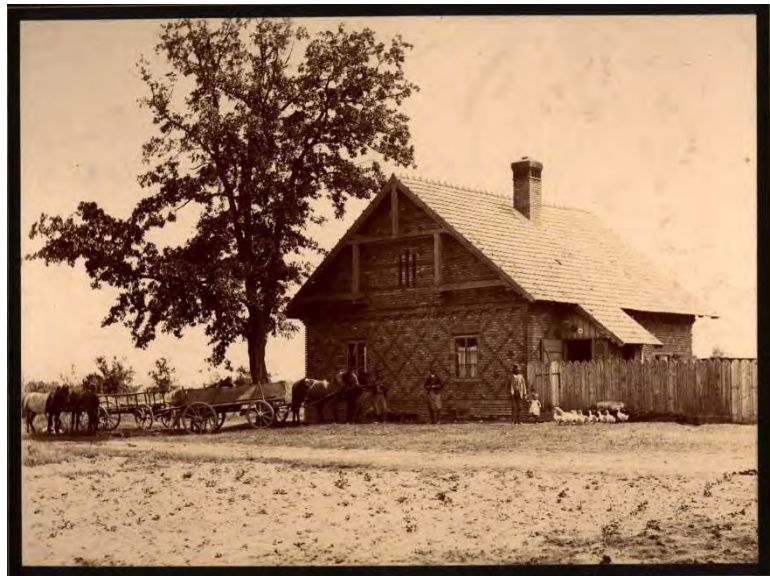
Abb. 1 Vlašic Hegerhaus beim Theim-Hof, rund um 1916

Bis zum Abriss in den frühen 50er Jahren blieb das Haus unbewohnt. Man findet das Objekt auch als dunklen Gebäudebestand auf einer Luftaufnahme aus dem Jahr 1952, zu jener Zeit also, als von unserem Staatsgebiet Luftbildaufnahmen gemacht wurden (1952-1953). Auf einer topographischen Karte, basierend auf Karten aus den Jahren 1954 bzw. 1960, ist das Bauwerk nicht mehr eingezeichnet. Auf Online-Kartenportalen des frühen 21. Jahrhunderts findet man den Ort des ehemaligen Hegerhauses bei der heute dort verlaufenden Gaspipeline [plynovod]. Nach den Worten eines Zeitzeugen existierte 1964 vom Forsthaus nur mehr das Fundament. Heute gibt es dort - bis auf Obstbäume und einen Brunnen - kaum noch Spuren von den Grundmauern.