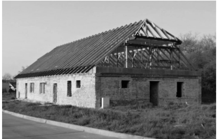
Bývalý dělnický domek s byty (stav duben 2014) Das ehemalige Arbeiterhaus mit Wohnungen (Stand April 2014)