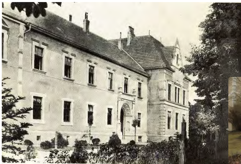
Eisgrub in Südmähren: Die Neue Schule Foto um 1900