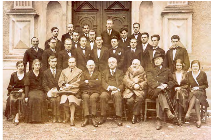
Abb. 4 Maturajahrgang 1932 Gruppenbild mit vier Damen.

Die anfangs schwierige Suche nach den Berufs- und Lebenswegen der Generationen von Eisgruber Studenten war für mich (Absolvent der Nachfolgeschule Wien-Schönbrunn, Mjg. 1957) faszinierend. Die oft beeindruckenden Biografien der Absolventen reflektieren ja die Geschichte des ganzen 20. Jahrhunderts, teilweise mit Verfolgung, Flucht und erzwungenen Lebenswenden. Auch gibt die Herkunft der Schüler die große Bandbreite der ehemaligen k.u.k. Monarchie und deren Nachfolgestaaten wieder. Schüler aus 8 verschiedenen Konfessionen mit 14 Muttersprachen waren vertreten, eine bis heute nicht mehr erreichte Universalität! Ebenso waren es