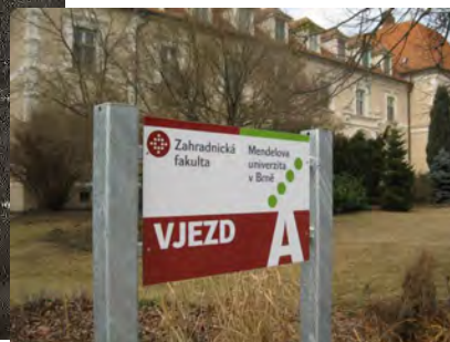
Gartenbaufakultät der Univ. Brunn Foto 2012

Zwei Jubiläen seien an den Anfang gestellt.