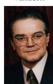
A. Auer Wien