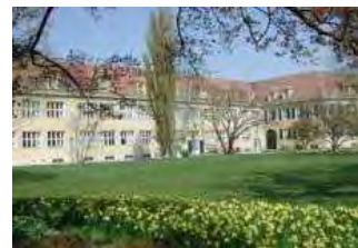
Abb. HBLA/HLF für Gartenbau 1999