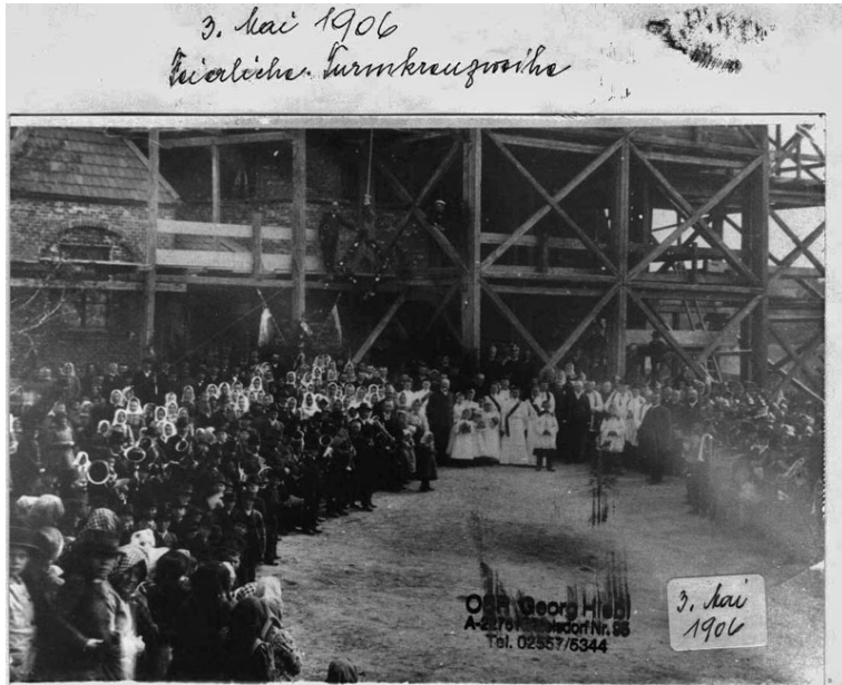
Die alte Pfarrkirche