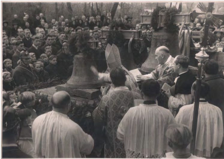
Glockenweihe, 16. November 1947