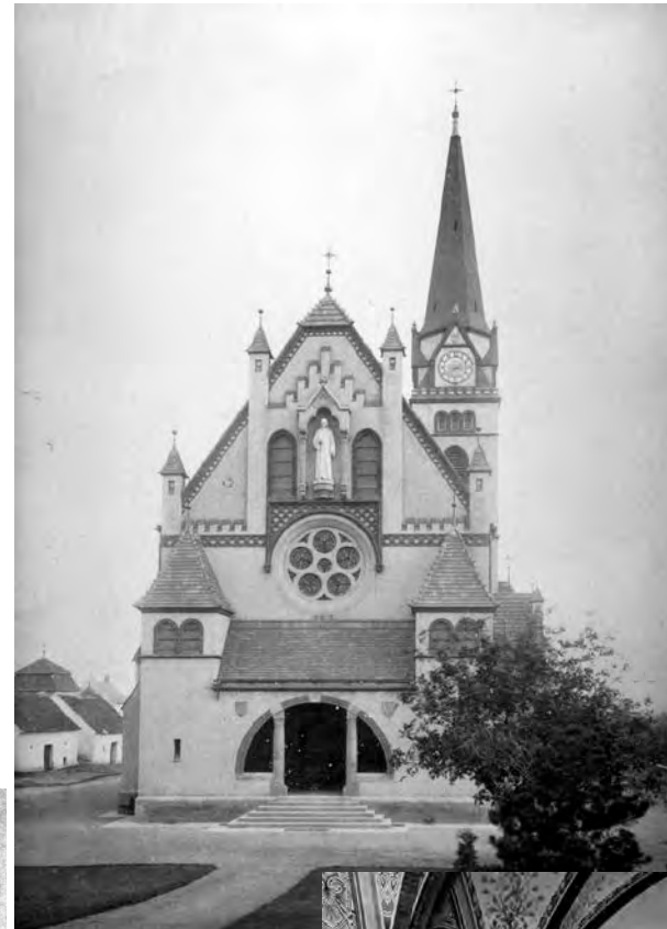
Die neue Pfarrkirche (erbaut 1905-1908)