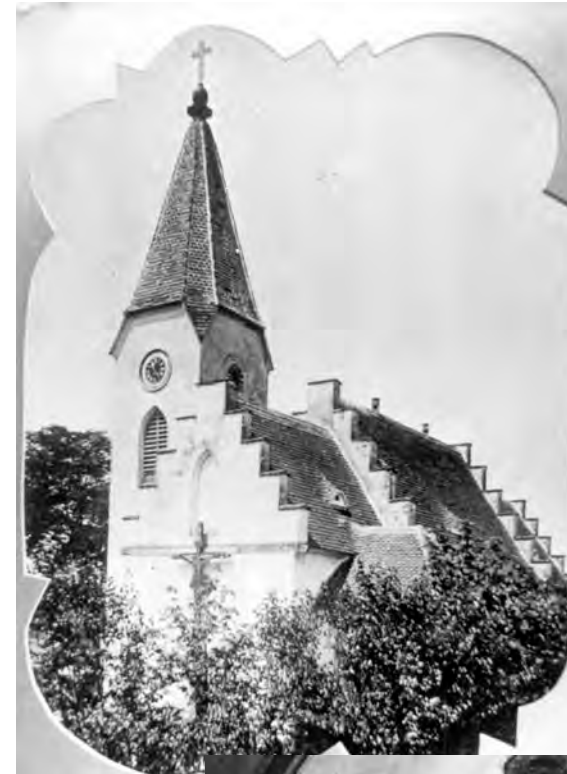
Die alte Pfarrkirche (erbaut 1905-1908)