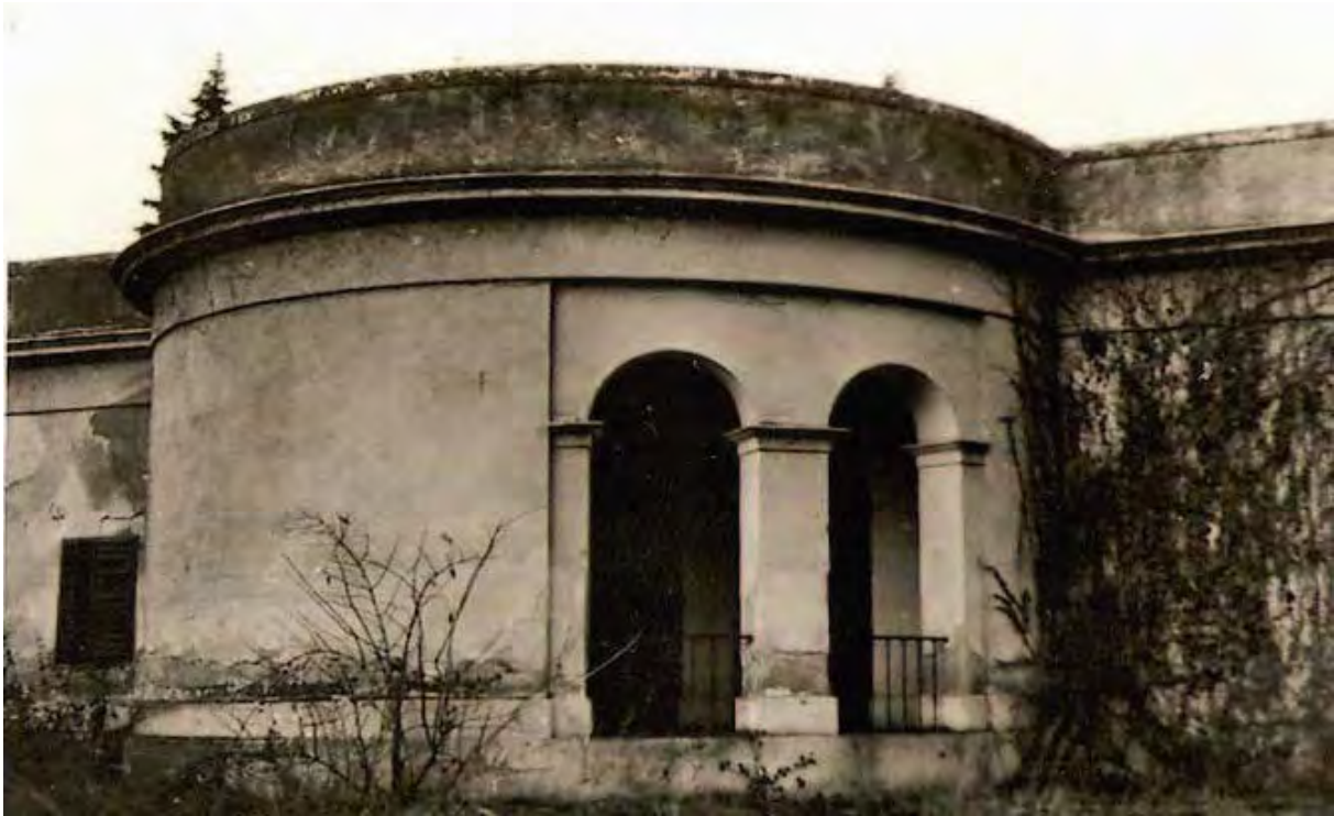
Abb. 7: Detail des Schlössls im Jahre 1956.

Die nächsten Reparaturen ließen nicht lange auf sich warten. Ausgeführt wurden sie nur zwei Jahre später. Im Jahr 1858 wurde wiederum ein Kostenvoranschlag für Bauarbeiten aufgestellt. Löhne für Handwerker und Arbeiter in Höhe von 97 Gulden 49 Kreuzer, Material schätzungsweise 135 Gulden 23 Kreuzer (eine voraussichtliche Gesamtsumme von 233 Gulden 12 Kreuzer). Der zusammengefasste Kostenvoranschlagsentwurf wurde am 15. Mai 1858 nach Wien gesendet. Die fürstliche Kanzlei erhielt dieses Schreiben und genehmigte es am 14. Juni 1858. Die Bauarbeiten wurden im Sommer 1858 ausgeführt. Wie aus einem Schreiben der Verwaltung des Feldsberger Anwesens vom 27. Dezember 1858 an die fürstliche Kanzlei hervorgeht, ersuchte man um Freigabe von 147 Gulden 49 Kreuzer Konventionswährung (C.M.) 15 für die Arbeitskosten und 200 Gulden und 31½ Kreuzer für das benötigte Material, insgesamt 348 Gulden und 20½ Kreuzer. Dieser Betrag lag 115 Gulden 8½ Kreuzer über dem ursprünglichen Budget (von 233 Gulden 12 Kreuzer). Die Reparaturen waren vermutlich dringend notwendig, da bereits am 12. April 1859 die Endabrechnung von der fürstlichen Kanzlei ohne Vorbehalte genehmigt wurde.