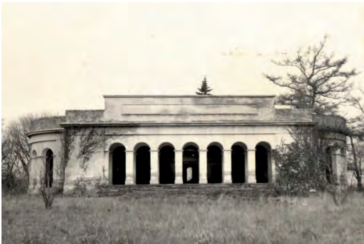
Průčelí záměčku v roce 1956

traktu objektu se nacházela dvě boční křídla, jež zahrnovala stáj pro dobytek, myslivcův byt a komoru. Tyto prostory, původně kryté šindelem, získaly novou krytinu z pálených tašek. Přibližné náklady činily: za práci 200 zlatých, za materiál 119 zlatých – tj. dohromady 319 zlatých. 12