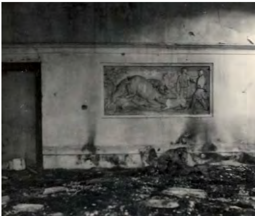
Interiér záměčku po požáru v roce 1956. Reliéf – Lov na jelena