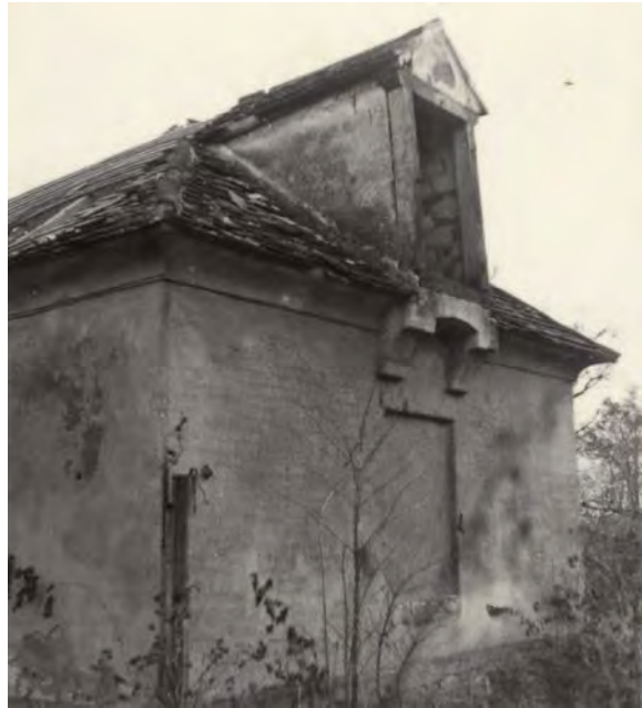
Abb. 13: Linker Flügel des Jägerhauses, Zustand im Jahre 1956.

Nach der Besichtigung des Objekts wurde festgestellt, dass es aufgrund des völlig desolaten Zustands und wegen der Lage in der Sperrzone nur sehr wenige Möglichkeiten für Bauarbeiten und einer finanziellen Kostendeckung gibt, zudem dies höchst unrentabel wäre. Angeblich soll das Jagdschlössl die Grenzsoldaten auch bei der Ausübung ihres Dienstes behindert haben, was nach Verhandlungen mit dem Grenzschutz ebenfalls zu berücksichtigen war.