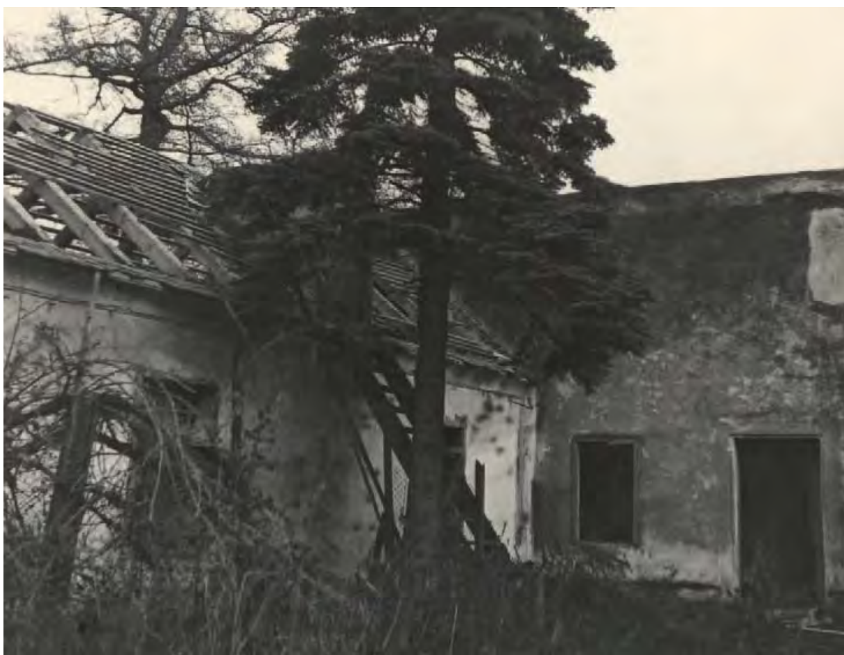
Byt hajného v roce 1956 – pravé křídlo myslivny