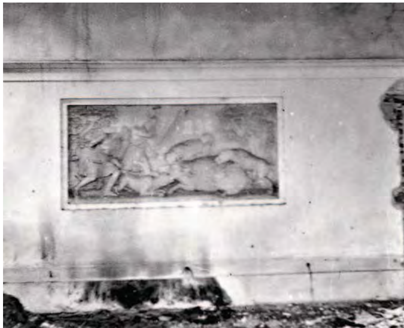
Abb. 9: Relief – Eberjagd.

und auch die Dicke der Vorderwand (ca. 0,5 m) abschätzen. Ein anderer Tram im gleichen Format hatte eine Länge von 5,5 m. Für 1 lfm Hartholz-Tram mit der Abmessung 16 x 18 cm wurden 34 Heller berechnet, insgesamt 8 Kronen 67 Heller. Weiters Hartholz mit der Abmessung 13 x 16 cm für 2 Gratsparren mit einer Länge von 6 m. Für 1 lfm wurden 32 Heller berechnet, insgesamt 3 Kronen 84 Heller. Und dann auch noch Hartholz mit der Abmessung 10 x 13 cm. In diesem Fall waren es 10 Stück Dachsparren mit einer Länge von 6,4 m, 2 Stück mit einer Länge von 3,4 m, 2 Stück mit einer Länge von 2,9 m, 2 Stück mit einer Länge von 2,5 m, 2 Stück mit einer Länge von 1,8 Metern und 2 Stück mit einer Länge von 1,1 m und letztendlich 10 Kehlbalken mit einer Länge von 1,5 m.