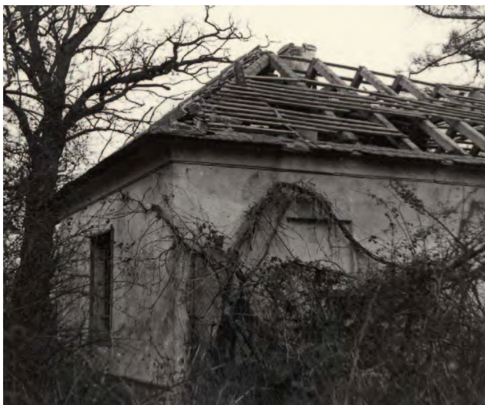
Abb. 12: Zustand des ehem. Jägerhauses im Jahre 1956.

Am 5. Dezember 1956 erfolgte die Besichtigung des Katzelsdorfer Objekts, um festzustellen, in welchem Zustand sich das Schlössl und die daran angrenzende Försterwohnung befindet.