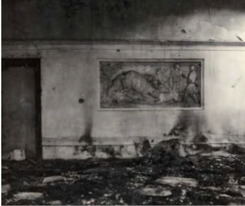
Abb. 8: Das Innere des Salettls nach dem Brand im Jahr 1956. Relief – Hirschjagd.

Auch das ans Schloßl angrenzende Försterhaus wurde Reparaturen unterzogen. Im Jahr 1905 musste zum Beispiel das beschädigte Stalldach ersetzt werden. Die Gesamtkosten beliefen sich auf: Maurerarbeiten 36 Kronen 35 Heller und Zimmermannsarbeiten 91 Kronen 45 Heller. Die Zimmermannsarbeit beinhaltet eine sehr genaue Stückliste: Hartholz mit der Abmessung 16 x 18 cm - dient als Verbindung mit dem Mauerwerk. Besteht aus zwei Tram mit einer Länge von je 10 m, welche sichtlich die beiden Giebel verbinden. Aus diesen Daten lässt sich die Gesamtlänge der Ställe (ca. 10 m)