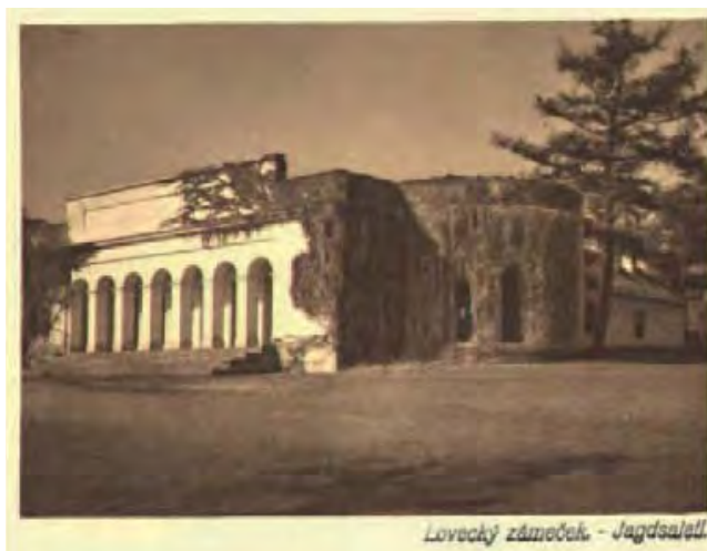
Lovecký záměček. - Jagdsaal.