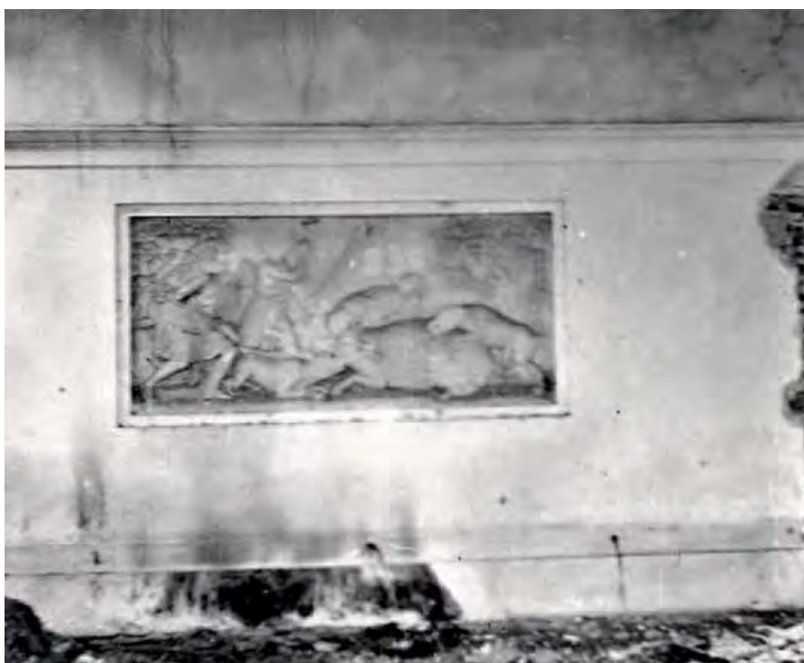
Reliéf – Lov na divokého kance

oba průčelní štíty. Z tohoto údaje lze odhadnout celkovou délku stájí – přibližně 10 m – a tloušťku průčelních zdí – přibližně 0,5 m. Stejný rozměr měl i jeden nový trám o délce 5,5 m. Za metr tohoto druhu kulatiny bylo účtováno 34 haléřů – celkem tedy 8 korun 67 haléřů. Dále tvrdé dřevo o rozměrech 13 × 16 cm. Jednalo se o dva kusy valbových krokví o délce 6 m. Za jeden metr bylo účtováno 32 haléřů – celkem tedy 3 koruny 84 haléřů. A ještě tvrdé dřevo o rozměrech 10 × 13 cm. V tomto případě se jednalo o deset kusů střešních krokví, přičemž jedna měla délku 6,4 m, dále o dva kusy střešních krokví o délce 3,4 m, o dva kusy střešních krokví o délce 2,9 m, o dva kusy střešních krokví o délce 2,5 m, o dva kusy střešních krokví o délce 1,8 m, o dva kusy střešních krokví o délce 1,1 m a konečně o deset kusů hambáleků, přičemž jeden měl délku 1,5 m. Za jeden metr