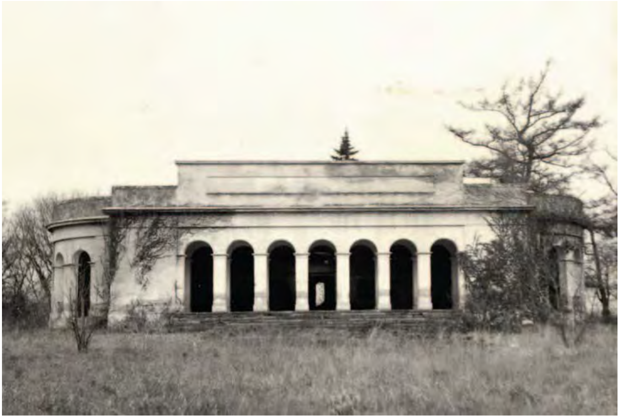
Abb. 6: Die Fassade des Schlosses im Jahre 1956.

die Stallungen für Kühe, die Jägerwohnung und eine Kammer untergebracht waren. Diese Bereiche, ursprünglich mit Schindeln gedeckt, bekamen eine neue Abdeckung aus gebrannten Dachziegeln. Die ungefähren Kosten betragen 200 Gulden für die Arbeitszeit und 119 Gulden für das Material, in Summe 319 Gulden. 14