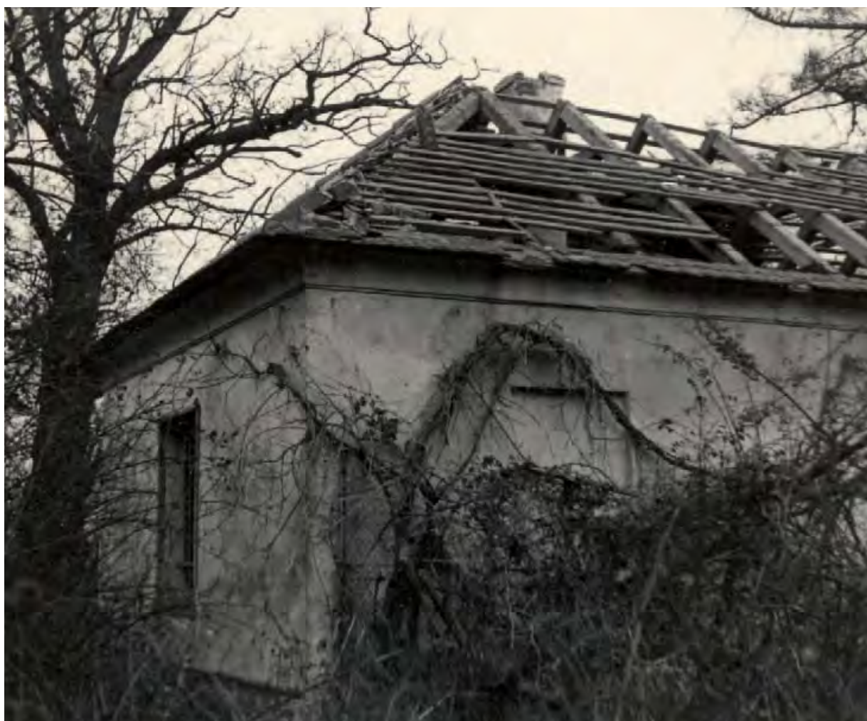
Stav bývalé myslivny v roce 1956