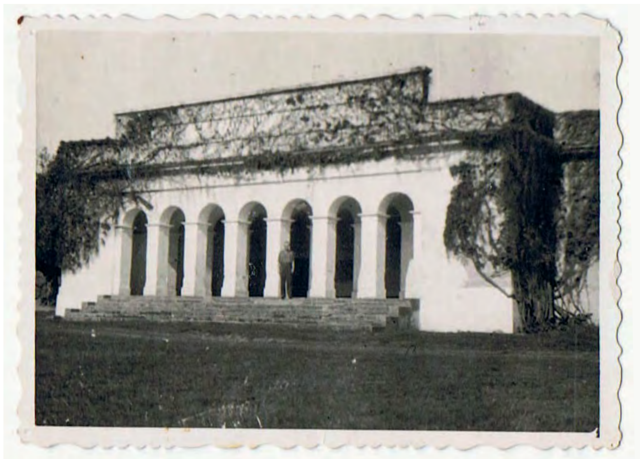
Hajný Michal Kycl v průčelí zámečku