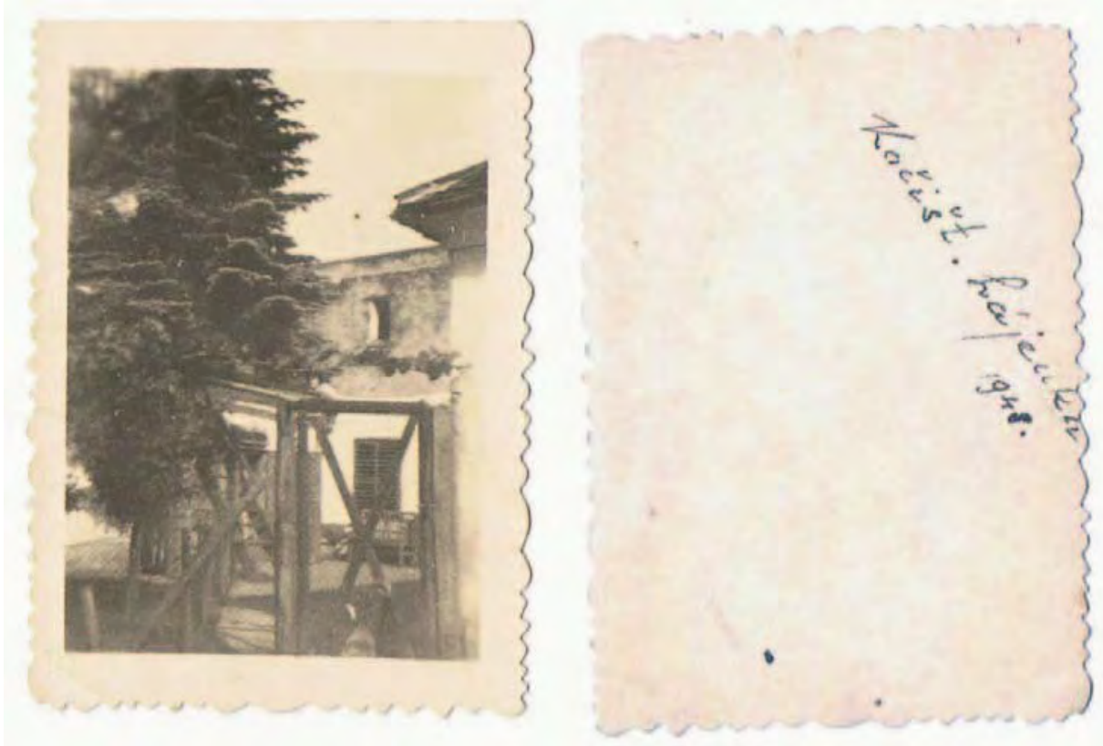
Abb. 10: Das Hegerhaus im Jahre 1948.

Für 1 lfm wurden 28 Heller berechnet, insgesamt wurden für 102,4 lfm Sparren und Kehlbalken mit der Abmessung 10 x 13 cm 28 Kronen 67 berechnet. 17