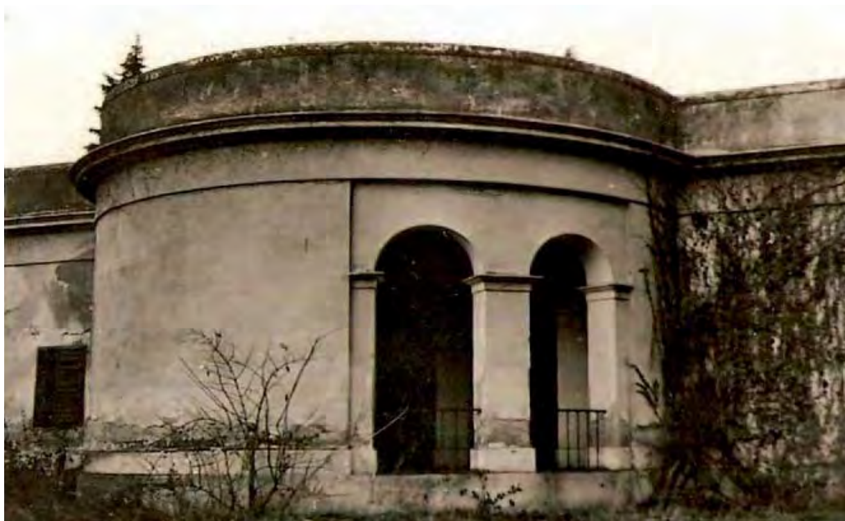
Detail zámku z roku 1956

a nádeníky se pohybovaly ve výši 97 zlatých 49 krejcarů, materiál byl odhadnut na 135 zlatých 23 krejcarů (celá pravděpodobná suma činila 233 zlatých 12 krejcarů). Souhrnný navrhovaný rozpočet byl zaslán do Vídně dne 15. května 1858. Knížecí kancelář jej přijala a schválila dne 14. června 1858. Stavební práce proběhly v průběhu léta 1858. Jak uvedla správa velkostatku ve své žádosti z 27. prosince 1858 adresované knížecí kanceláři, činila vydání 147 zlatých 49 krejcarů konvenční měny na práci realizátorů přestavby a 200 zlatých 31 ½ krejcarů na použitý materiál, což celkem bylo 348 zlatých 20 ½ krejcarů. Tato částka o 115 zlatých 8 ½ krejcarů převyšovala původní rozpočet (tj. 233 zlatých 12 krejcarů). Opravy byly patrně nezbytné, protože dne 12. dubna 1859 knížecí kancelář konečné vyúčtování bez výhrad schválila.