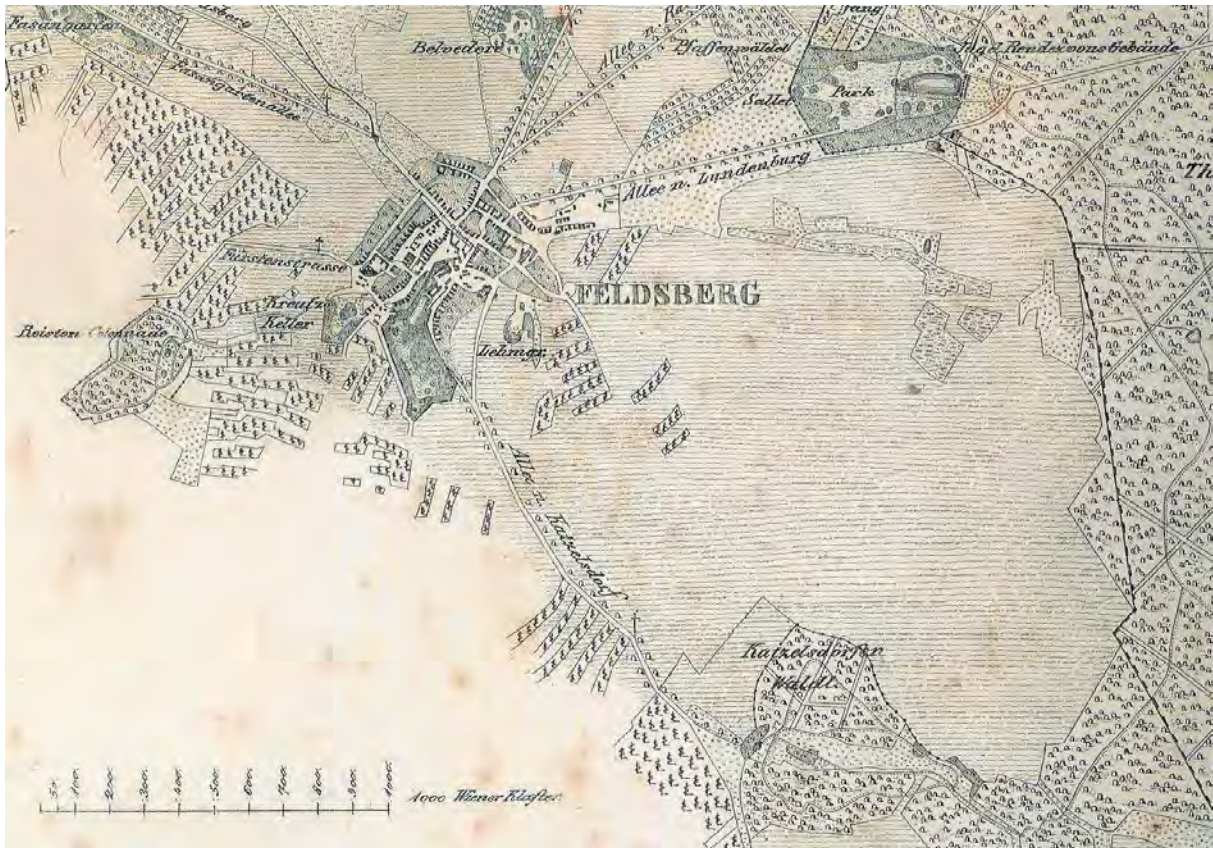
Abb. 1: Feldsberg und der Katzelsdorfer Wald auf einer Karte um 1840.

Im Wald unweit vom Föhrenhof 1 , nahe der Straße ins österreichische Katzelsdorf, verbirgt sich ein Jägerhaus, ein interessanter Bau aus der Zeit des Klassizismus. Es ist ein breiter Hauptteil, dreiseitig mit Säulen umgrenzt, an den Schmalseiten schließen halbrunde Räume an, mit einem langen Korridor vorne. Die Wände schmücken Reliefe mit Jagdmotiven. Der gesamte Jagdpavillon ist mit Wildem Wein bewachsen, der malerisch, wie Gardinen, von den Simsen herabhängt. 2