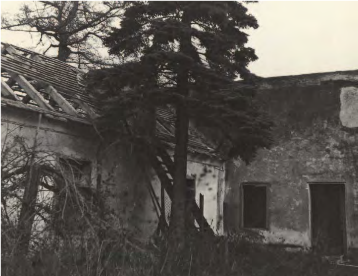
Abb. 11: Der rechte Flügel der Försterwohnung im Jahre 1956.

Zu Beginn der fünfziger Jahre des 20. Jahrhunderts begann man mit der Verschiebung der Grenzzone und der Errichtung des „Eisernen Vorhangs“. Der Wildhüter wurde ausquartiert und die Forstverwaltung ließ alle neuen Teile des Gebäudes ausbauen, da sie angeblich für neu errichtete Waldarbeiterwohnungen gebraucht wurden. Das Gebäude, das zugleich auch des Hegers Wohnung war, wurde zu Lagerplatz und Heustadel.