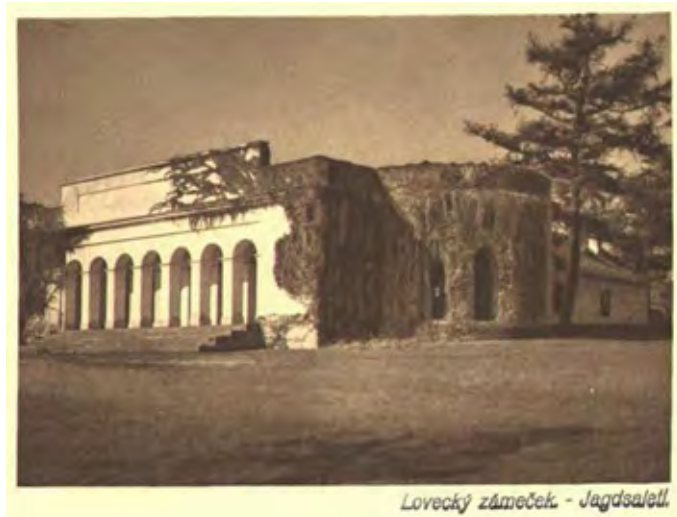
Abb. 3: Jagdhaus im Katzelsdorfer Wald in den Zwanziger Jahren des 20. Jahrhunderts.