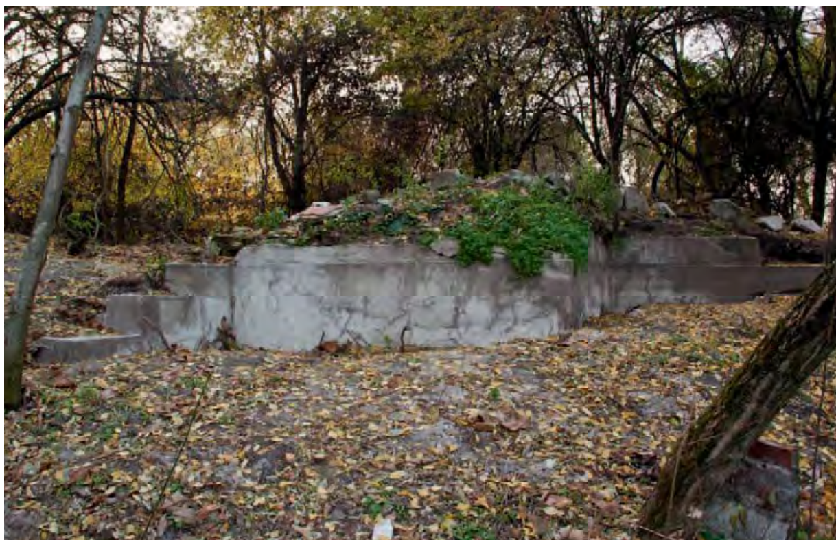
Zbořeniště záměčku v roce 2012

pod stavbou a druhý v ovocném sadu. 31 Jako zdroj vody sloužila studna, která byla však vyhloubena až po válce. 32