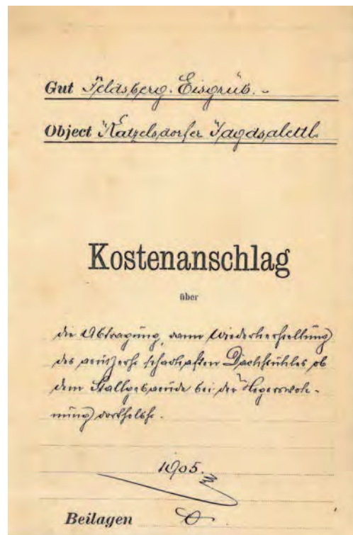
Abb. 4: Titelblatt - Kostenanschlag über die Abtragung, dann Wiederherstellung des äußerst schadhafte Dachstuhls ob dem Stallgebäude bei der Hegerwohnung dortselbst. - aus dem Jahre 1905.