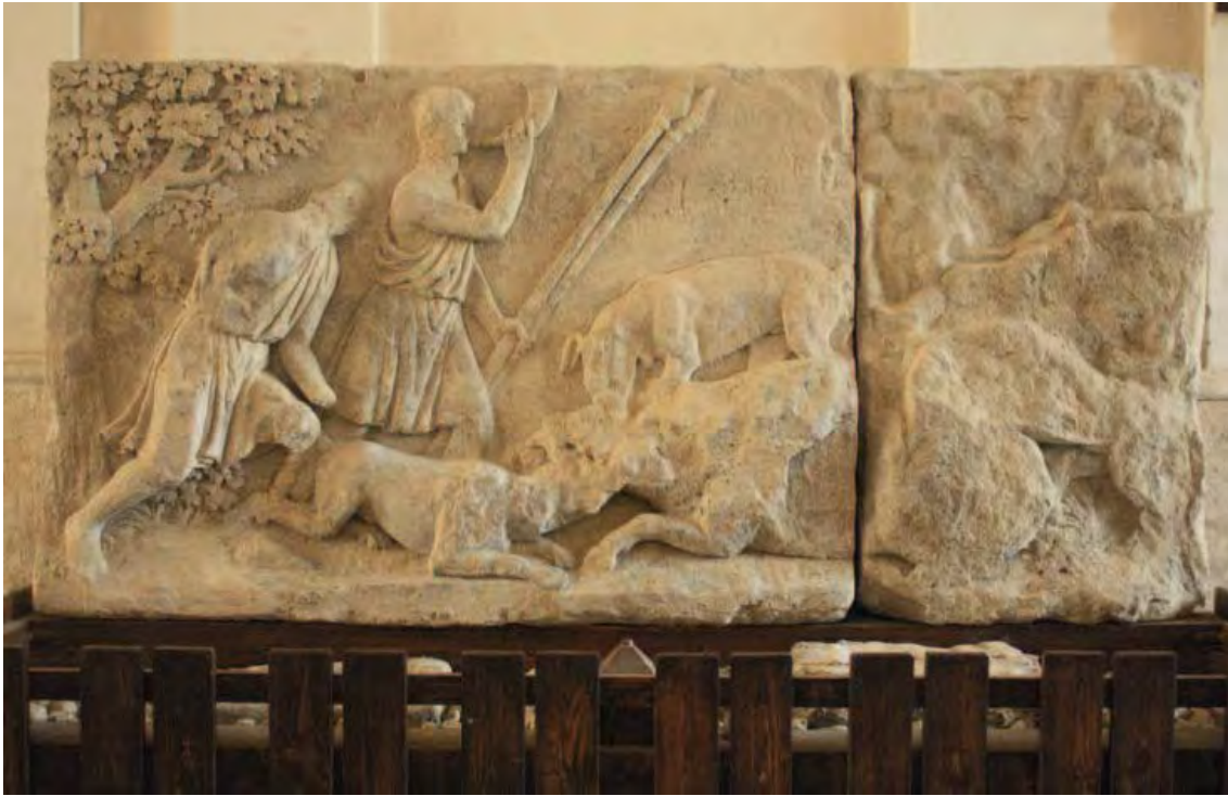
Abb. 16: Relief „Eberjagd“. Zustand im Jahr 2012.