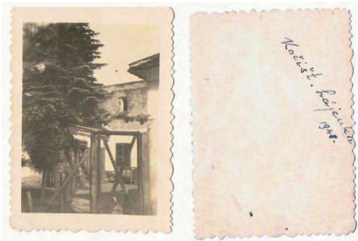
Hájenska v roce 1948