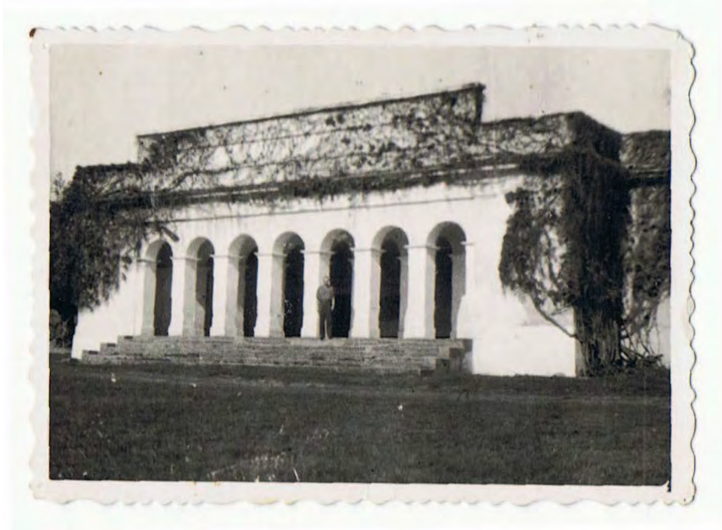
Abb. 14: Förster Michael Kycl im Portal des Schlössls