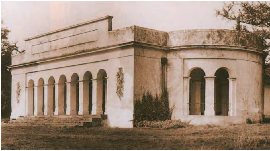
Abb. 2: Das Katzelsdorfer Schlössl, undatiert. Die Fotografie zeigt noch die Original Reliefverzierung.