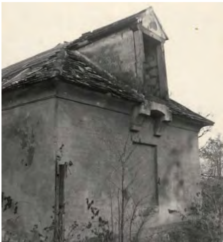
Levé křídlo myslivny – stav v roce 1956

Po prohlídce objektu se došlo k závěru, že z důvodu jeho zcela dezolátního stavu, dále vzhledem k jeho umístění v zakázaném pásmu, omezeným možnostem stavební výroby a opatřením finančního krytí by bylo zabezpečování celé stavby neúčelné. Dále se mělo vzít v potaz i jednání s Pohraniční stráží, pro niž byl údajně zámeček do určité míry překážkou při výkonu služby.