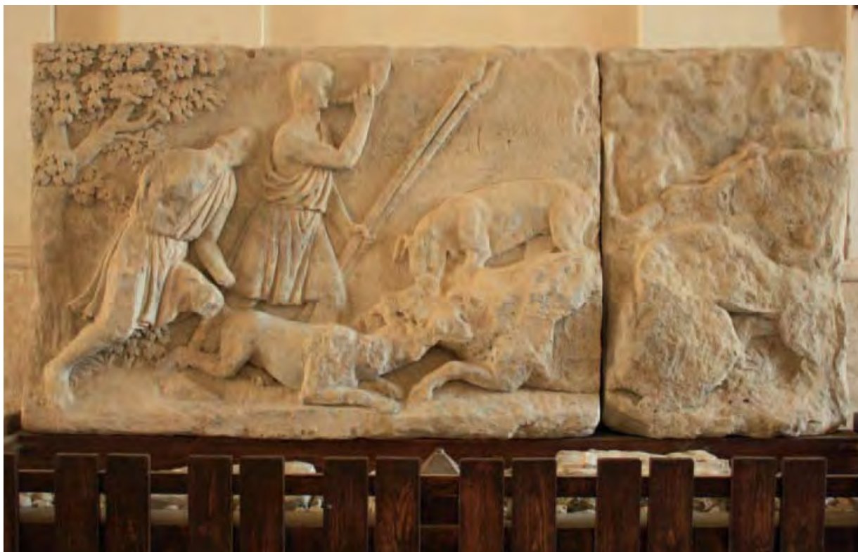
Reliéf – Lov na divokého kance. Stav v roce 2012